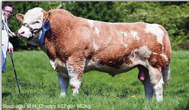
Soup oğlu W.H. Chappy 632 gün 862kg