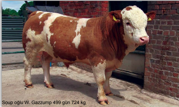
Soup oğlu W. Gazzump 499 gün 724 kg